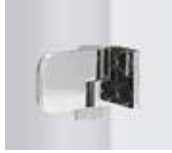
Beschlag Außenansicht Wand/Glas