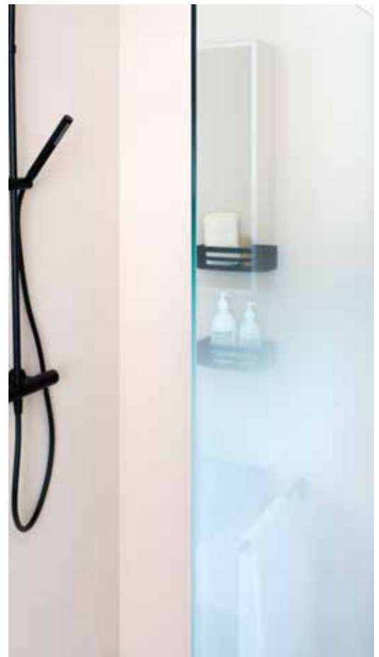
WALK-IN BLACK GLASTREND Duschabtrennung, 1200 x 2000 mm, m. HS, ESG Glasdekor Fade LA282005942