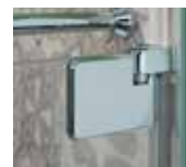
Türbeschlag Wandbe- festigung