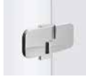
Pendelbeschlag chrom Außenan- sicht Glas/Glas, innen flächenbün- dig, Hebe-Senk- Mechanismus