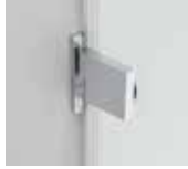
Türbeschlag Wandbe- festigung