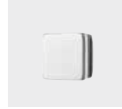
Griffknopf (Serienaus- stattung)