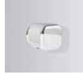
Griff, 1-seitig, bei 1/4-Kreis 2-seitig (Serienaus- stattung)